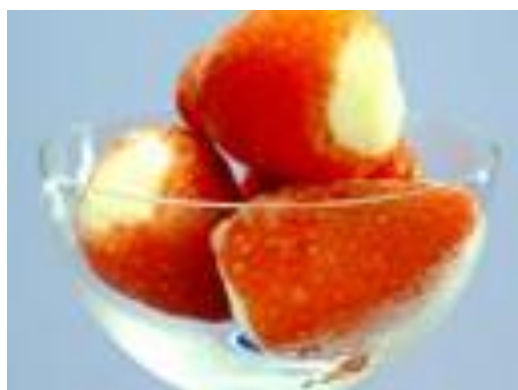
草莓姬 450日元(含税495日元)