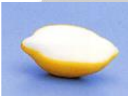
Lemon Sorbet 450yen (495yen)