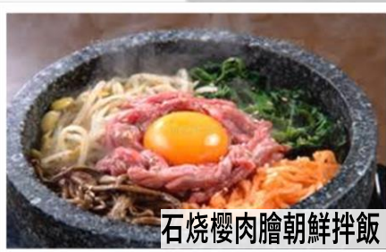
石燒櫻肉膾朝鮮拌飯