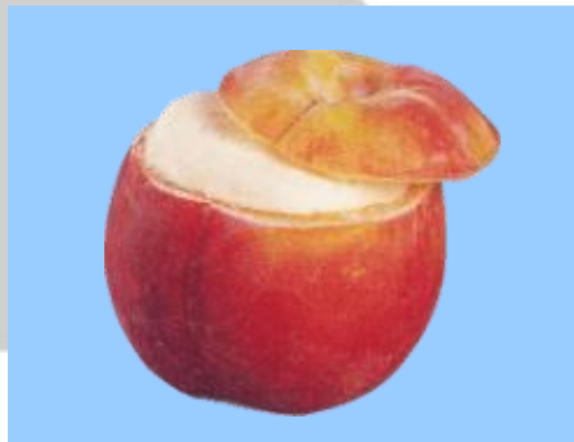
桃子冰沙 690日元(含税759日元)