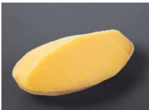
Mango Sorbet 580yen (638yen)