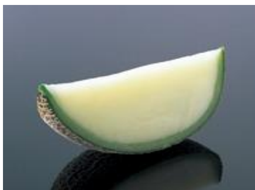
Melon Sorbet 650yen (715yen)