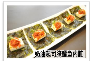
奶油起司腌鳕鱼内脏