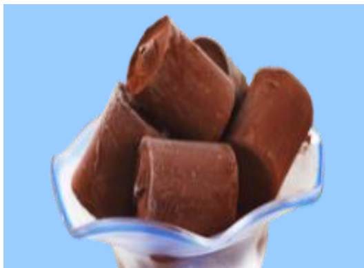
生巧克力冰淇淋 450日元(含税495日元)